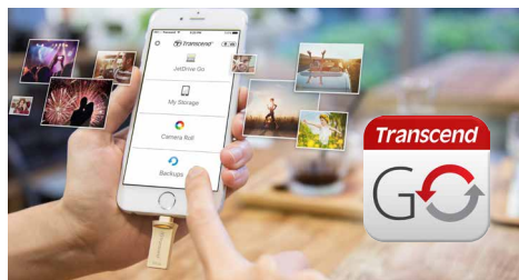
搭配專屬JetDrive Go App

創見JetDrive™ Go 500 Lightning/USB 3.1隨身碟專為iPhone®、iPad®及iPod®所設計，不僅提供最高128GB的儲存空間，更採用鋅合金外殼，優雅呈現時尚的流線造型。搭配創見專屬JetDrive Go App，JetDrive Go 500不再只是一只隨身碟，它能做的比你想像得多更多！